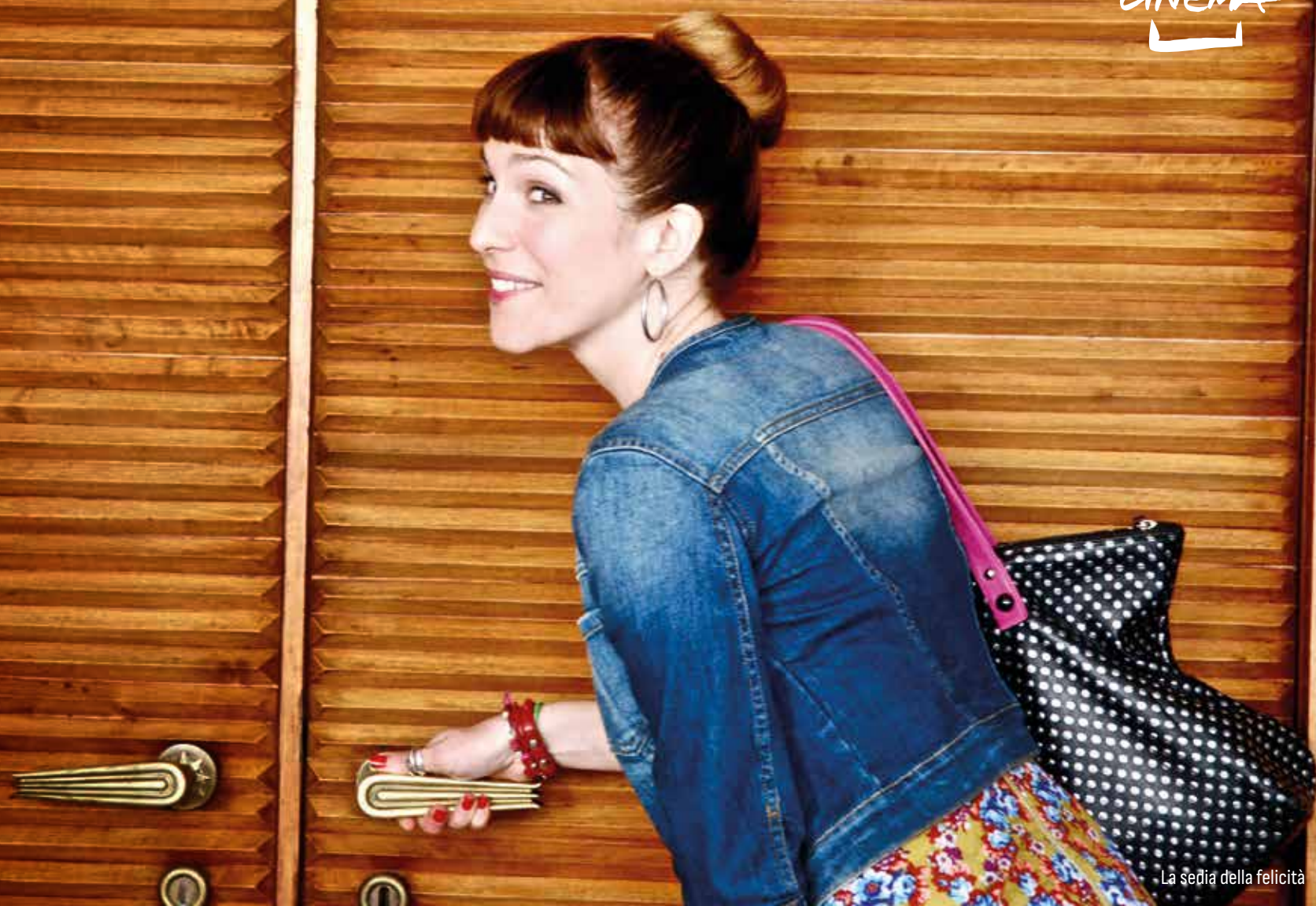
La Sedia della felicità

Dieci anni fa, il 22 gennaio, nella sua Padova ci lasciava Carlo Mazzacurati, a soli 57 anni. Impossibile dimenticarlo.