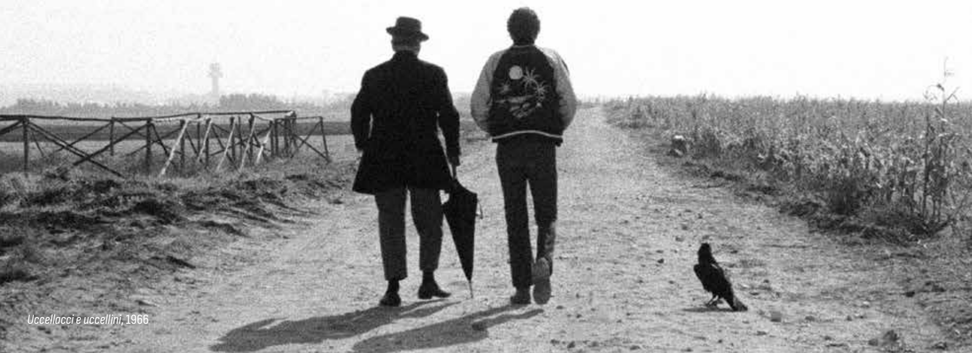
Uccellacci e uccellini, 1966