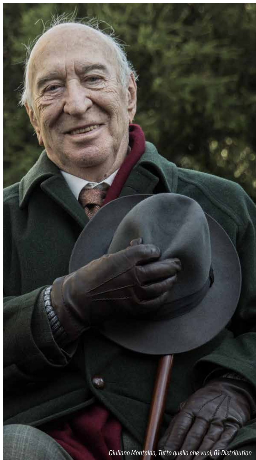
Giuliano Montaldo, Tutto quello che vuoi , 01 Distribution

→ REPLICA MARTEDÌ 17 ORE 20.30 SALA FELLINI